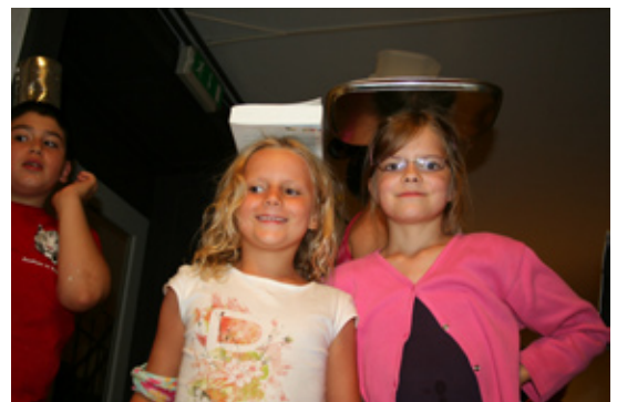
Si certains ont l'équilibre dans le sang, ce n'est pas le cas de tout le monde!