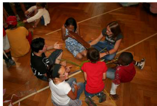
Pas facile de manger une tartine quand on fait 2 centimètres de haut...

professeur a réussi à réparer sa machine et à nous faire rétrécir... un peu trop d'ailleurs. Et les enfants se retrouvèrent de la taille d'une poupée Barbie. Ils se sont donc adaptés, en participant à différents jeux, tels que le baby-foot géant, le Pictionary en regardant depuis le 2ème étage, ou encore le mikado géant.