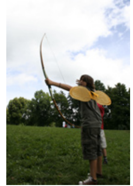
Les enfants, sans le savoir, ont réalisés à leur tour les méfaits de Loki