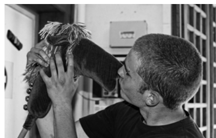
Un nouveau couple s'est formé