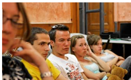
Les cadres à la fin de la journée