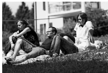
Y'en a qui agissent et d'autres...

Le retour-colo aura lieu le dimanche 21 septembre à l'Eglise St-Pie X. L'occasion pour tous de ressasser les bons souvenirs lors d'un repas canadien. Les photos du camp seront présentées aux parents. Le rendez-vous est fixé à 11h sur place.