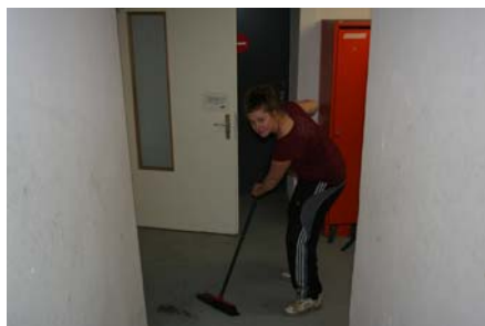
La directrice aux corvées